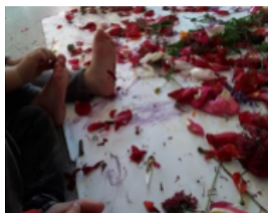
El Patufet- Sant Bartomeu del Grau