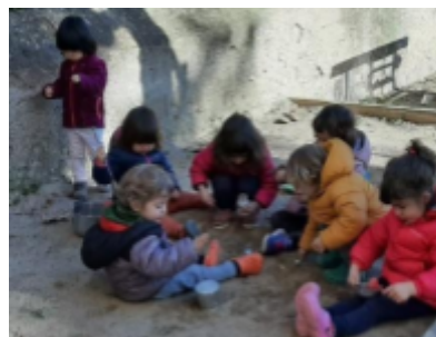
Els Petits Roures - Sant Feliu Sasserra