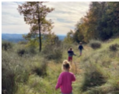
Gafarronets - Lluçà