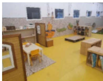
Estel - Olost