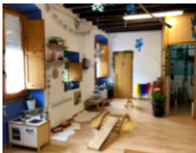
El Cauet - Alpens