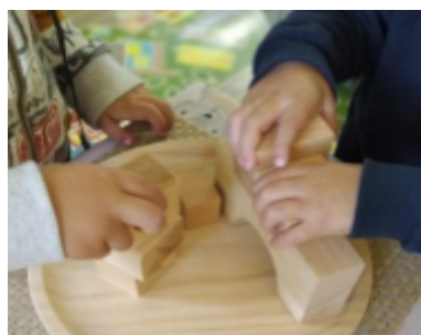
Petit Llevant - Oristà