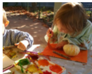
El Cargol - Sant Boi de Lluçanès